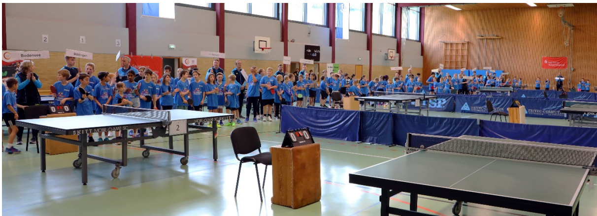
114 Teilnehmer aus ganz Baden-Württemberg kämpften um den Einzug ins Bundesfinale.

Am 04. Mai 2024 fand in Niedernhall nach vielen Jahren wieder der Verbandsentscheid der Minimeisterschaften statt.